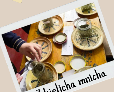
Z kielicha mnicha

Zajęcia zapoznające uczestników z rolą bursztynu dla Pomorza i Kaszub. Dzieci mają okazję wysłuchać kaszubskiej legendy związanej z jantarem, a także własnoręcznie wykonać bursztynowe bransoletki/ozdoby.